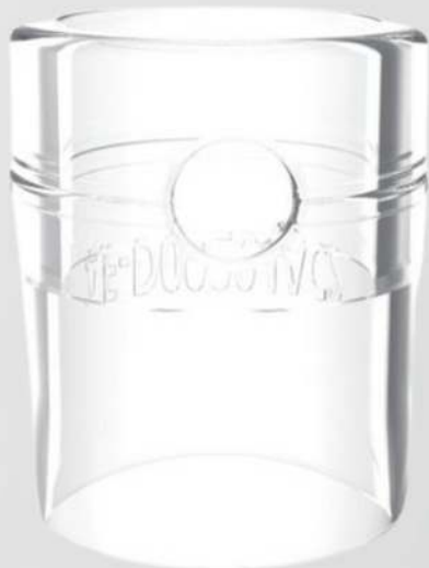
Cap Distal Reto