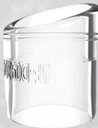
Cap Distal Obliquo

ORIFÍCIO LATERAL QUE PERMITE DRENAGEM DO FLUIDO PARA MANTER A VISÃO ENDOSCÓPICA LIMPA.